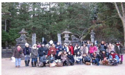
国際交流研修旅行