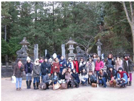
International Exchange Study Trip