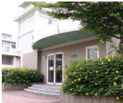
International Student House

Japanese undergraduate students and international students will stay here.