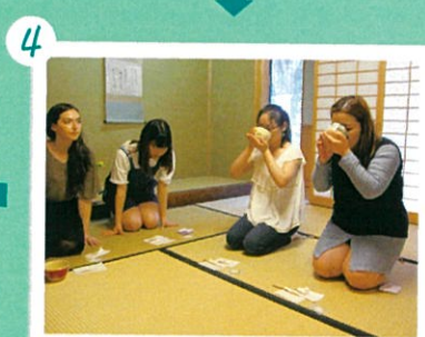
6 作法にならって、お茶をいただきます。