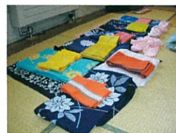
きつ きょうしつ 着付け教室