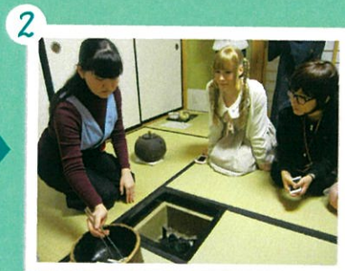
2 普段は見られないところも、特別に見せてくれました。