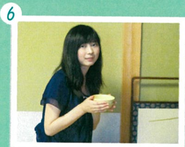
4 おいしいお茶に大満足。