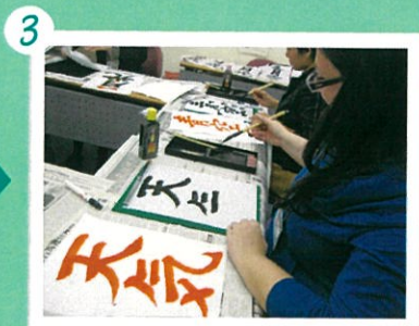
3 先生のお手本をみながら、好きな文字や言葉を書きます。