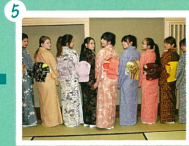
ようやく無事に着終わりました。