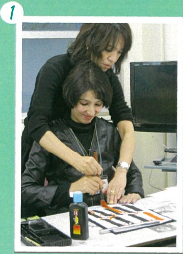
1 先生が筆の使い方を教えて下さいます。