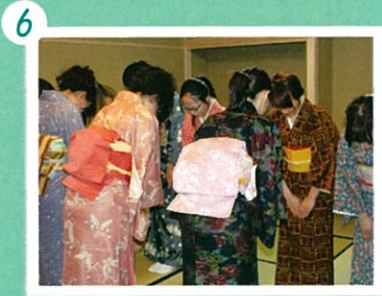
お辞儀の仕方など、所作も学びます。