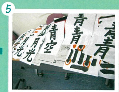
5 たくさん練習しました。