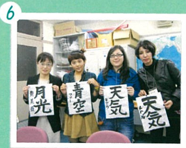
6 最後に清書をして、作品が完成!