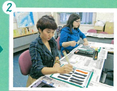
2 基本的な書き方を半紙で練習します。