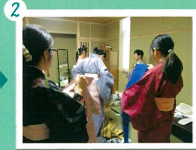
先生からご指導を受けながら、一つずつ、帯を締めていきます。