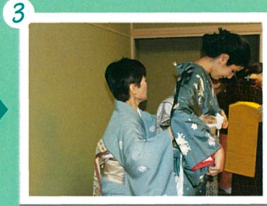
難しいところや後ろ側は先生が直して下さいます。