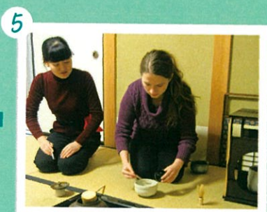
5 今度は自分で点ててみます。