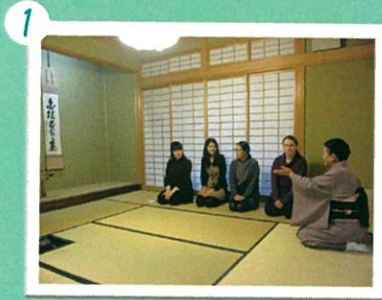
1 掛け軸やお花について先生が説明して下さいます。