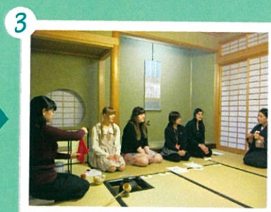
3 部長さんのお点前を先生が解説して下さいます。