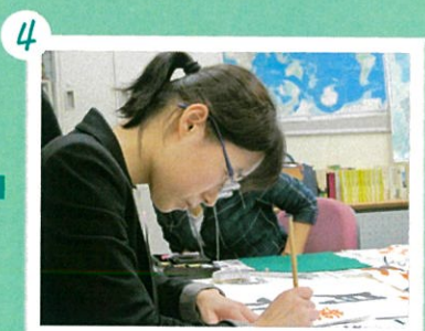
4 真剣な表情で取り組みます。