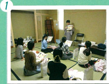
最初に着物の歴史について説明を受けます。