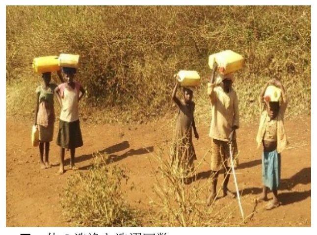
【写真 2】川から 10L のタンクに水を入れて帰る様子