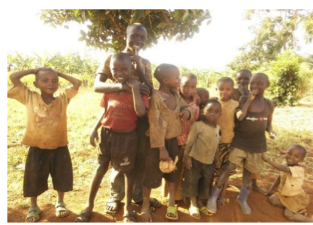
【写真 1】日中近所の子どもたちは集まって遊 んでいる