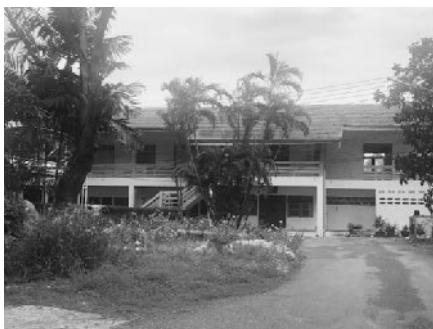
写真1. 女性たちが暮らすシェルターハウス ご飯を食べたりアクティビティをおこなう。

また、受けているプログラムやアクティビティは個人の興味や状況によって異なるが、6人中、学校に通っている2人を除き4人が何かしらの職業訓練を行っていることが分かった。職業訓練を楽しんでいることは判明したが、具体的に将来の自分の仕事に繋がたいと考えている人はいなかった。将来の夢やこれからの展望について聞くと、出産を控えている女性からは、もともと仕事をしていた職場への復帰を望む声や、妊娠によって途中で行けなくなった学校に通いなおしたいという声があった。子どもが既にいる女性からは、学校を卒業し、子どもと一緒に実家に帰りたいという声や、まだわからないという声があった。特徴的であったのは、大卒以上で就業経験のある26歳以上の女性は、これまで所持していた車を売ったり、貯蓄をしたりなど出産後の育児に備えた準備をおこない、将来に関しても、やりたいことや夢を語るのではなく、子どもの教育などのため、何をすべきかを考えた「子ども」が主語の将来設計をしていた。一方で19歳以下の女性は、自分の将来の夢を持っていて主語が「自分」である事が特徴的だった。一方で、「学校に通っているだけで精一杯なのでまだわからない」という声もあった。