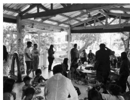
写真2. 子どもたちのいる保育所の様子。国内外から沢山の人がチャリティーで訪れる。