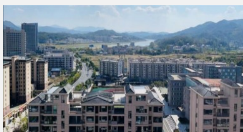
写真3 県城に立ち並ぶ新築集合住宅群

結婚準備中の男性およびその親世代への聞き取り調査、ならびに県城における不動産会社および住宅団地での現地観察を通じて、住宅購入にかかる費用が親世代の貯蓄を一举に枯渇させるほどに重大な経済的負担となっていることが明らかとなった。さらに、県城で購入される新築住宅の多くは購入時点では内装が施されておらず、実際に居住するためには、さらなる多額の内装費を要する。また、家具・家電の購入費用や住宅ローンの返済も加わるため、住宅購入後の内装段階において既に結婚費用の家計圧迫が顕在化していた。親世代への聞き取り調査では、「子ども（息子）を結婚させることは親としての最大の責任だ」「とりあえず結婚を済ませて、その後はまた都市へ出稼ぎに行き、家族全員で力を合わせて返済していくしかない」という語りがみられた。このように、結婚準備には、住宅購入だけの一時的な高額支出にとどまらない、その後の家計維持に長期的