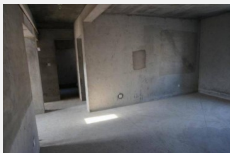
写真4 内装前の新築住戸