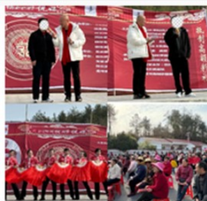
写真10 高額結納金抑制を呼びかける文芸公演