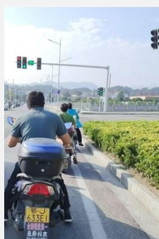
写真7 県城と村を往復する移動手段