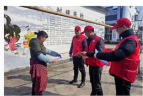
写真8 婚姻費用抑制の宣伝活動