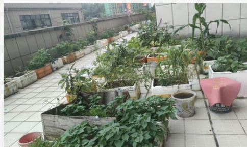
写真6 住宅周辺で継続される家庭菜園