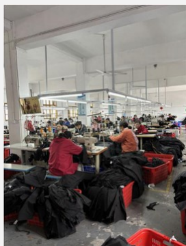
写真5 県城における女性の就労空間

と消費のあり方を調整し、そこで捻出した資源を息子世代へと引き継いでいることを示している。したがって、高額な結婚費用が親世代に及ぼす影響は、経済的な負担にとどまらない。それは、健康状態が悪化した後もなお、就労の継続を余儀なくさせるという、親世代の身体への深刻な負荷だった。