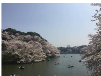
千鳥ヶ淵 ちどりがふち