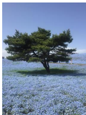
国営ひたち海浜公園の ネモフィラ