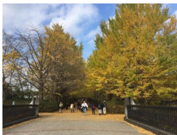
昭和記念公園の銀杏