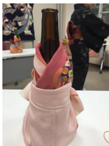
文化教室の包む教室