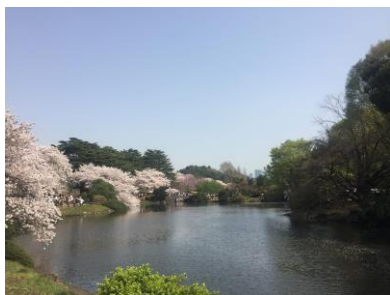
新宿御苑 しんじゅくぎょえん