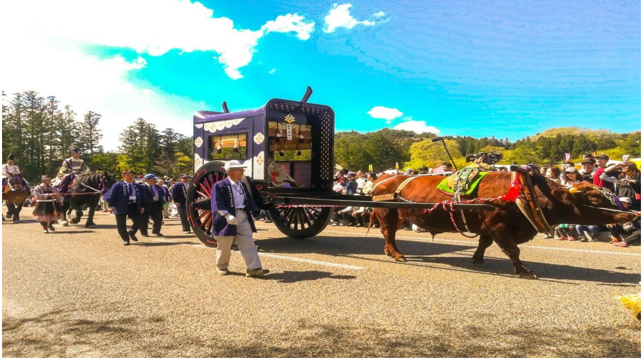
Hirauzumi, İwate Eyaleti /03.05.2019 "Haru no Hujiwara Festivali"