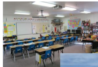
小学校教室 (イメージ)