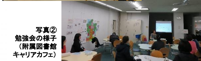
写真② 勉強会の様子 (附属図書館 キャリアカフェ)