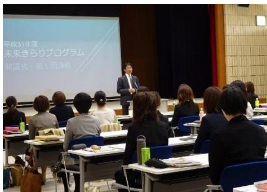
「未来きらりプログラム開講式」の様子 （2019年4月26日 福井県庁にて）