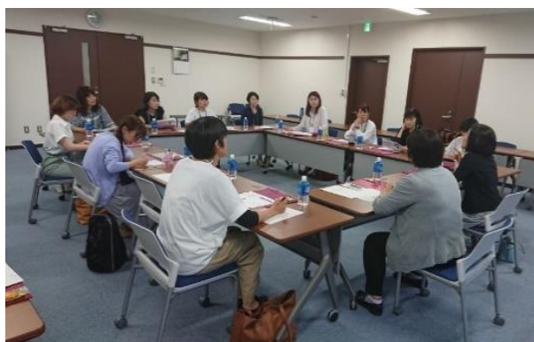
「お茶の水女子大学論」ロールモデル講演会 講師との懇談会（2019年7月10日 本学にて）