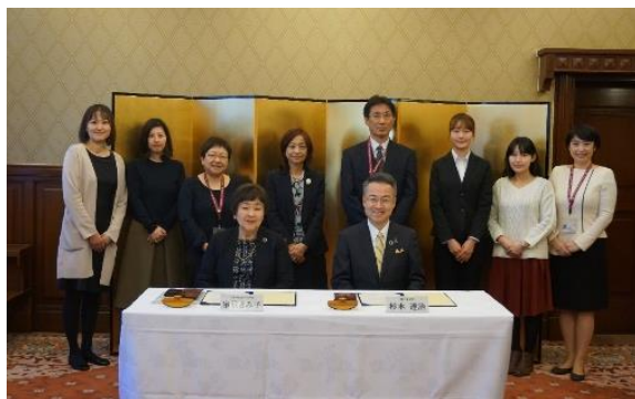
相互協定締結式後の記念撮影 （2020年2月5日 本学にて）