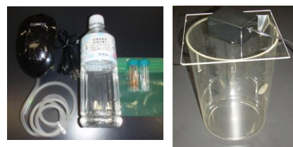
珪藻培養セット ウニ幼生飼育装置

珪藻(植物プランクトン)を培養し、それを餌にウニの遊泳幼生(動物プランクトン)を育てて教室で海の生態系の一部を再現します。発生実験に引き続いての幼生飼育を希望する場合はこちらも含わせて申し込んで下さい。