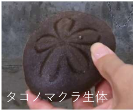
タコノマクラ生体

全国各地と関連オンラインイベントで繋がりながら、ウニの受精実験を通して海を学ぼう！表現しよう！