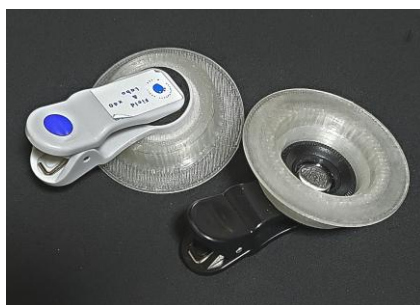
クリップスコープ（40倍仕様）